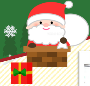
ホワイト クリスマス