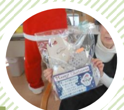
ホウケウオーマ-の プレゼント