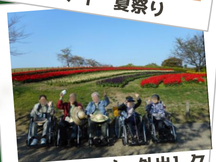
10月 ティ 外出シク