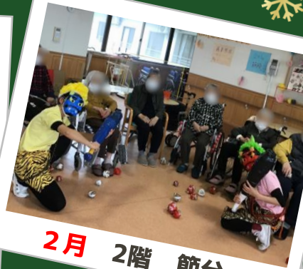
2月 2階 節分