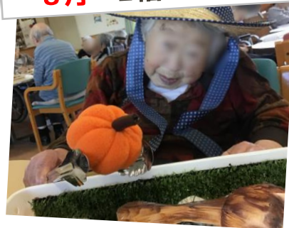
11月 2階 収穫祭