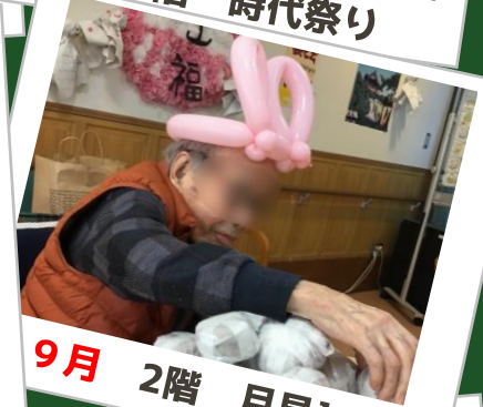
9月 2階 月見シク