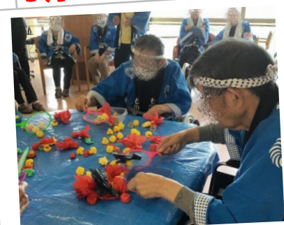
8月 2階 夏祭り