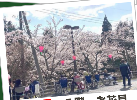
4月 3階 お花見