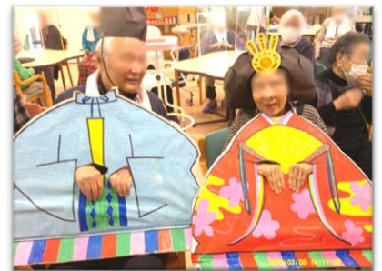
3月 3階 ひな祭り