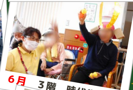
6月 3階 時代祭り