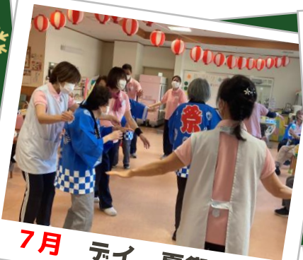
7月 ティ 夏祭り