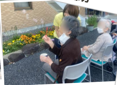
5月 3階 外気浴